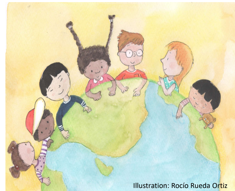
Illustration: Rocío Rueda Ortiz

Georg Krämer: Was ist und was will Globales Lernen? Aus: Jahrbuch Globales Lernen 2007/2008