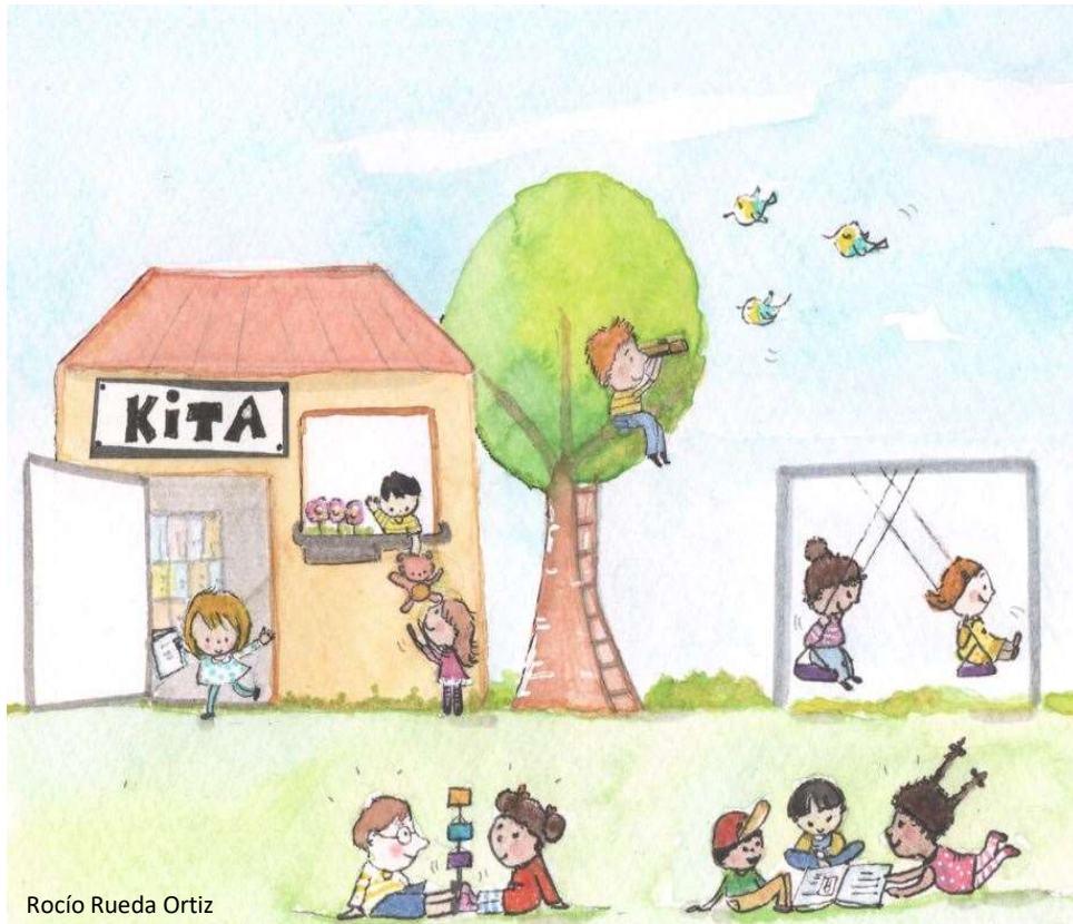
Rocío Rueda Ortiz