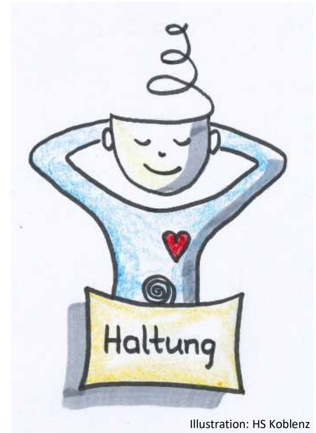
Illustration: HS Koblenz

Wie können wir uns selbst und andere für Nachhaltigkeit begeistern?